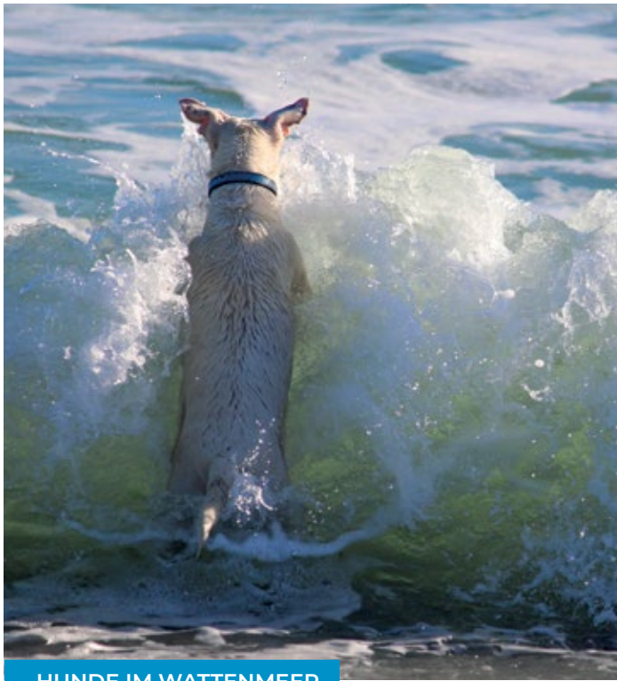
HUNDE IM WATTENMEER

Auf den gesamten Deichkronen, auf dem rot geklinkerten Deichkronenweg im Strandbereich, dürfen Hunde an der Leine spazieren gehen. Von Oktober bis März können Hunde zudem am Wasser auf der Deichpromenade angeleint den Urlaub genießen.